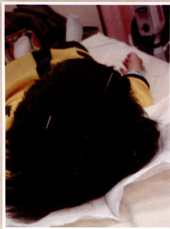
正接受針灸治療的幼童。